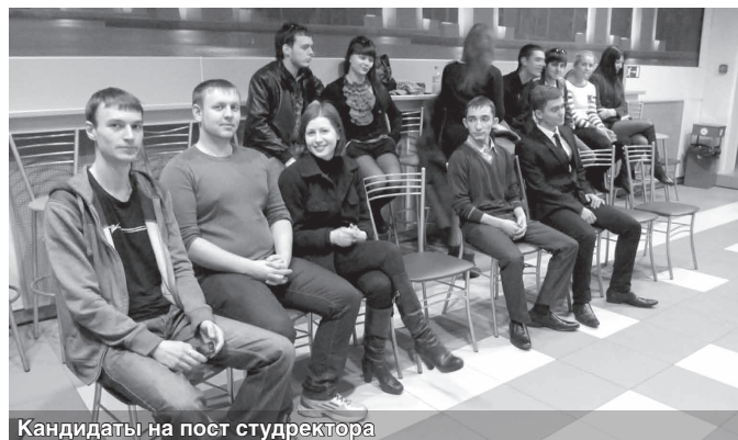
Кандидаты на пост студректора

Кандидатам предстоит провести предвыборную кампанию и пройти курс индивидуальных консультаций по следующим дисциплинам: выборные технологии, PR-акции, искусство публичных выступлений, психология лидера, технология управления.