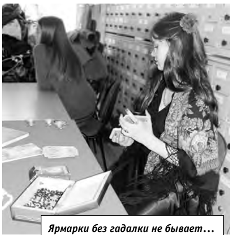
Ярмарки без гадалки не бывает...