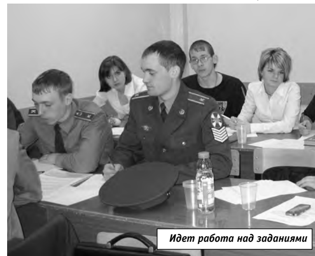
Идет работа над заданиями