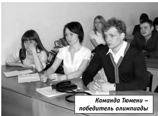
Команда Тюмени – победитель олимпиады

Кроме того, все команды прошли проверку на знание теории.