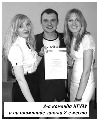
2-я команда НГУЭУ и на олимпиаде заняла 2-е место

Заданием для всех команд стало «создание» интернет-магазина по продаже одежды. Нужно было выполнить обоснование этого проекта, составить сам проект и представить его.