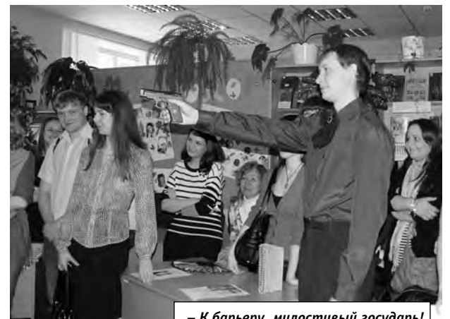
– К барьеру, милостивый государь!