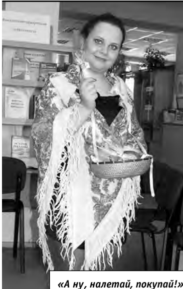
«А ну, налетай, покупай!»