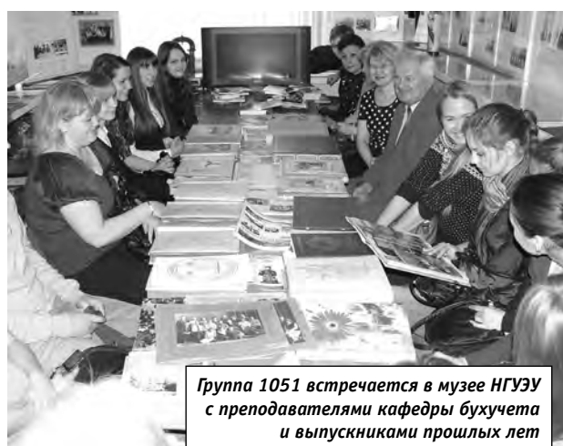
Группа 1051 встречается в музее НГУЭУ с преподавателями кафедры бухучета и выпускниками прошлых лет

«Студентам – о вузе и профессии» – так называется проект, который в нынешнем учебном году реализует музей истории НГУЭУ. Его цель – лучше познакомиться первокурсников с историей нашего университета и его сегодняшним днем, с профессией, которой они обучаются, с преподавателями и руководителями их базовых кафедр. Гостями таких встреч также становятся выпускники данных специальностей прошлых лет, которые могут рассказать тем, кто только начинает учебу, много интересного.