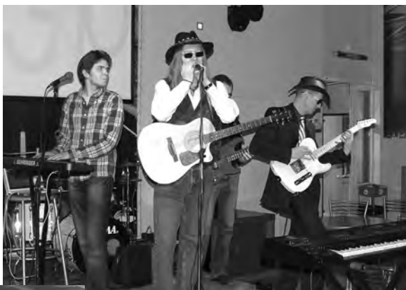
Вечер сопровождала музыка ансамбля «The news»

Программа вечера включала еще много интересных конкурсов и выступлений – обо всем не расскажешь! Но можно успеть до конца учебного года еще раз окунуться в атмосферу «ПРО ЭкТО», посетив финальную встречу. Напоминаем: она состоится в студклубе 17 мая. Начало – как всегда в 17 часов.