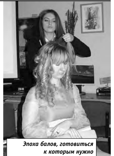
Эпоха балов, готовиться к которым нужно было очень серьезно

И, завершая разговор, хочется обязательно отметить еще одно обстоятельство. Готовясь к этим мероприятиям, студенты группы прочитали немало относящихся к данным темам произведений художественной литературы. То есть мало того, что существенно расширили эрудицию относительно нравов и быта описываемых времен, но и обогатились духовно, приобщившись к неисчерпаемому кладезю беллетристической классики.