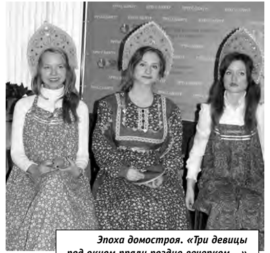
Эпоха домостроя. «Три девицы под окном пряли поздно вечерком...»