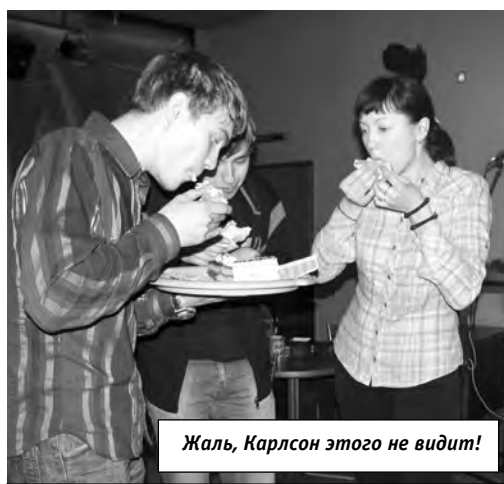
Жаль, Карлсон этого не видит!