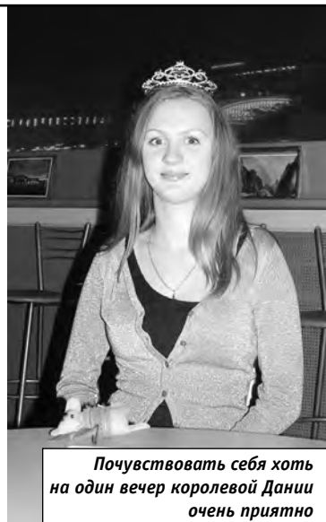
Почувствовать себя хоть на один вечер королевой Дании очень приятно