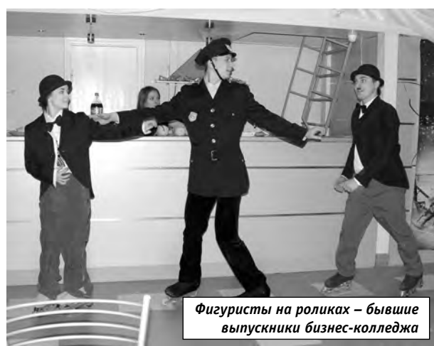
Фигуристы на роликах – бывшие выпускники бизнес-колледжа